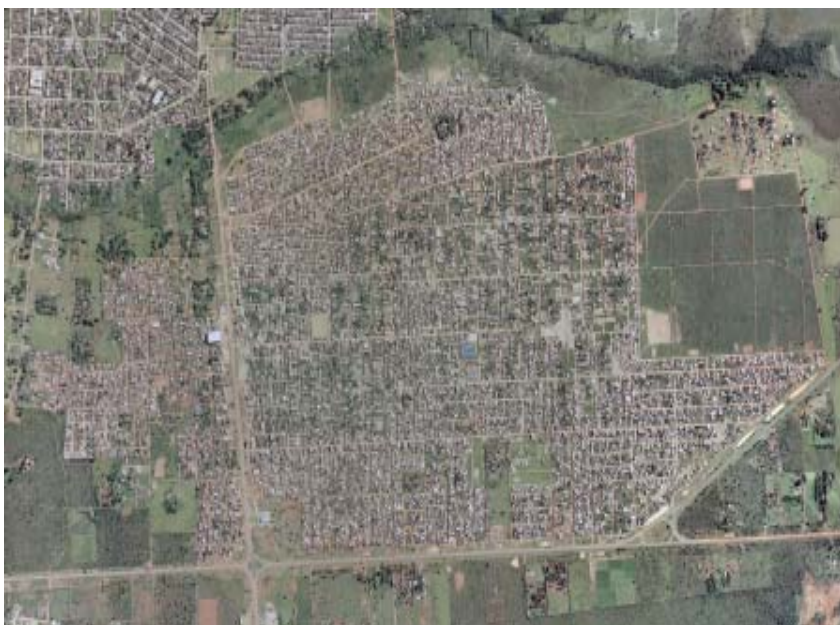
Mestre D'Ármas 2005