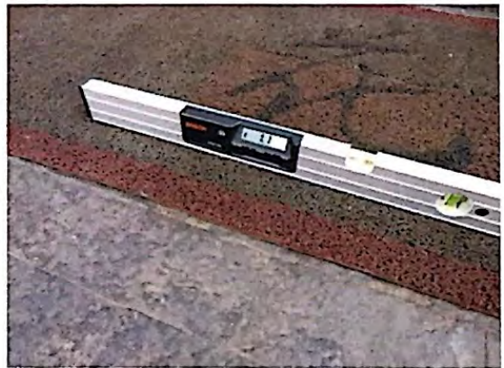
Fotografia 6: Inclinação transversal da rampa de entrada do estabelecimento