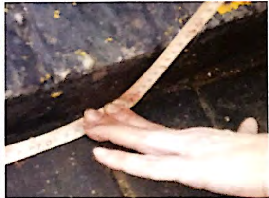
Fotografia 12: Degrau resultante da intersecção do passeio e da rampa de acesso ao estabelecimento