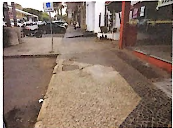
Fotografia 8: Vista geral da calçada da SCLS 408 em active/declive