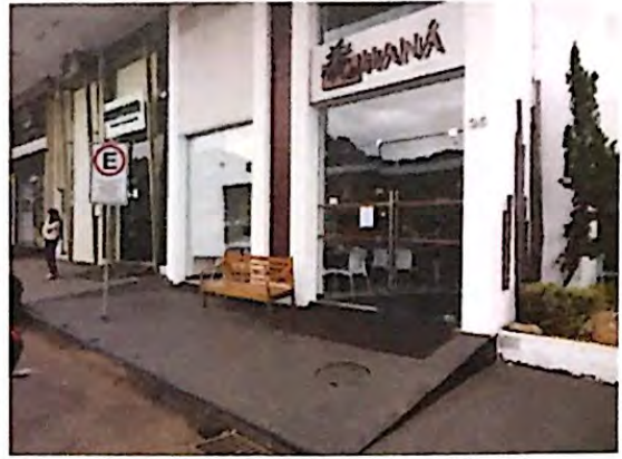
Fotografia 2: Entrada do Restaurante Haná