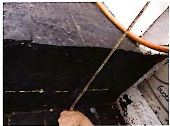
Fotografia 10: Degrau resultante da intersecção do passeio e da rampa de acesso ao estabelecimento