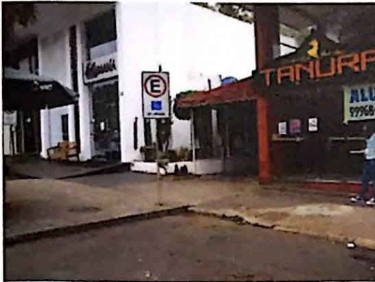
Fotografia 1: Localização do Restaurante Haná na extremidade do Bloco B, da SCLS 408