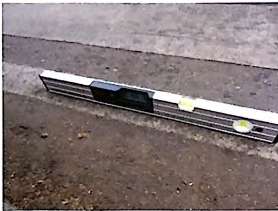
Fotografia 9: Inclinação da via da SCLS 408/409