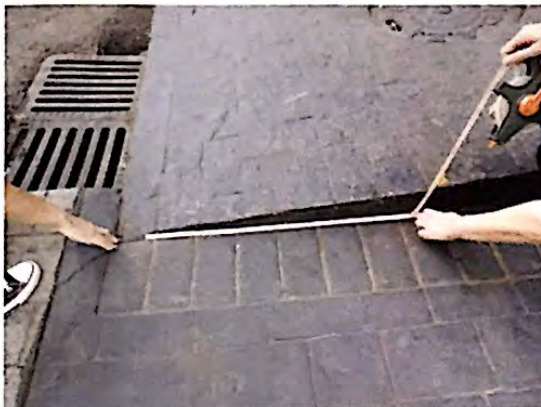
Fotografia 11: Largura mínima para passagem de cadeira de rodas