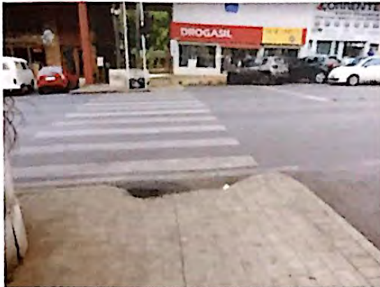
Fotografia 7: Via de veículos da SCLS 408/409 em active/declive