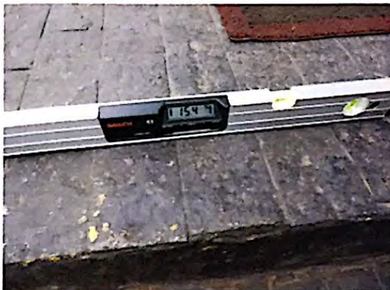
Fotografia 5: Inclinação longitudinal da rampa de entrada do estabelecimento