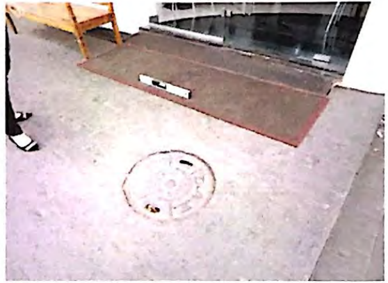
Fotografia 4: Entrada do restaurante