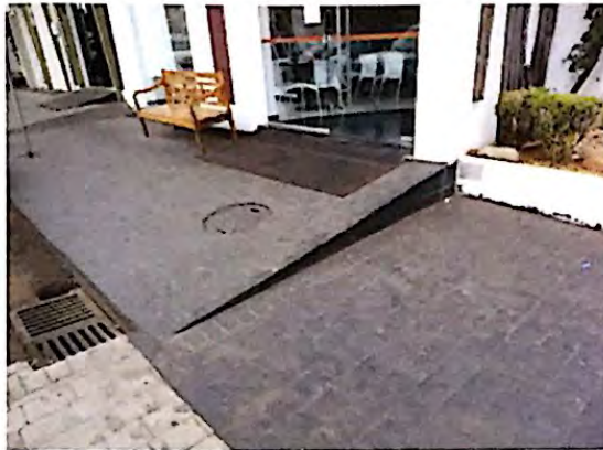
Fotografia 3: Rampa de acesso ao restaurante