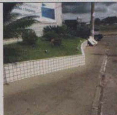
Calçada em frente ao lote