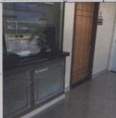
Balcão de atendimento