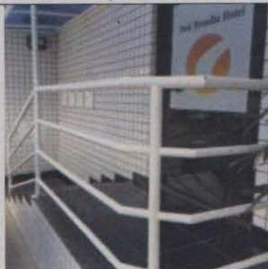
Escada externa: guarda corpo