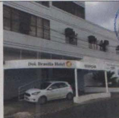
Embarque e desembarque