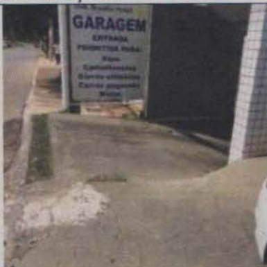
Acesso de veículos ao lote